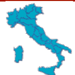
Eventi in corso